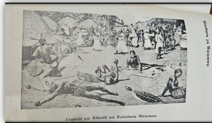
Picha 4: Uvamizi wa kikatili wa kukamata watumwa