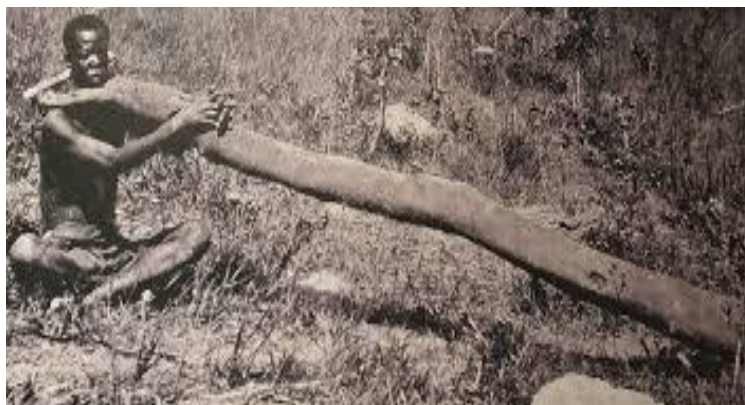
Picha 1: Mateso waliyopata watumwa

Mbali na uvamizi wa moja kwa moja, njia nyingine ya kupata watumwa ilikuwa kupitia biashara ya moja kwa moja kati ya viongozi wa kijadi na wafanyabiashara wa watumwa. Viongozi wa makabila kama Wayao na Wanyamwezi walihusika katika kuuza watu wao kwa kubadilishana na bidhaa kama bunduki, nguo na chumvi (URT, 1977). Hali hii ilichochea hisia za usaliti miongoni mwa vizalia ambao walihisi kuwa viongozi wao waliwasaliti kwa kushiriki katika biashara hiyo haramu na ya kikatili.